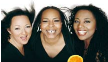
Die „Rounder Girls“

feierlicher Akt unter Mitwirkung von kirchlichen und politischen Würdenträgern. Abhaltung eines ökumenischen Festgottesdienstes.